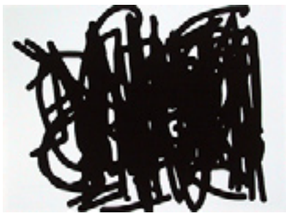
Hymne und Heimkehr